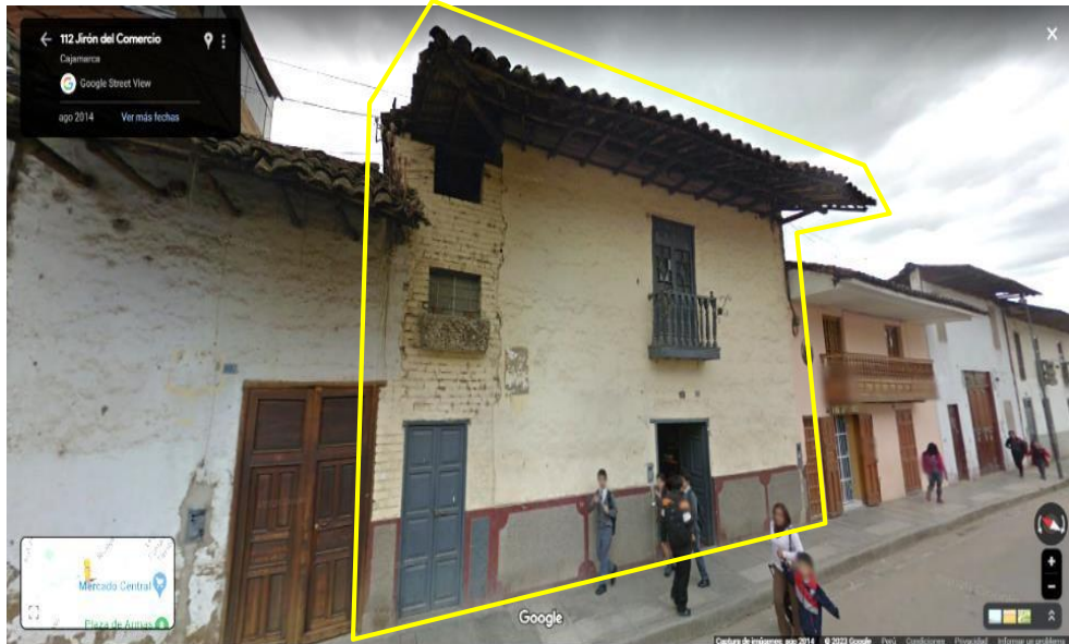
Imagen N° 2: Fachada del bien inmueble original con elementos arquitectónicos y estéticos originales, del año 2014.

"Año del Bicentenario, de la consolidación de nuestra Independencia, y de la conmemoración de las heroicas batallas de Junín y Ayacucho"