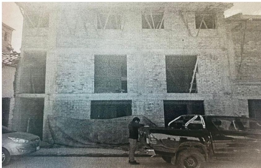
Imagen N° 3: fachada de bien inmueble luego de demolición y con construcción en proceso al 1 de junio de 2021