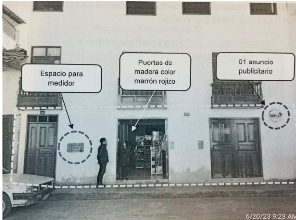
Imagen N° 4 y 5: fachada de bien inmueble con nueva edificación al 20 de junio de 2023

"Decenio de la Igualdad de Oportunidades para Mujeres y Hombres" "Año del Bicentenario, de la consolidación de nuestra Independencia, y de la conmemoración de las heroicas batallas de Junín y Ayacucho"