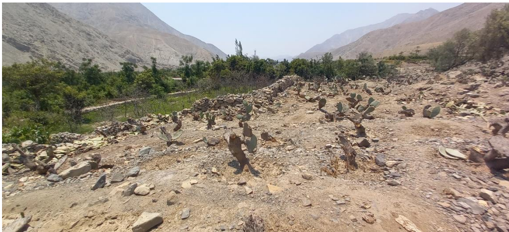
Foto 05: vista del Sitio Arqueológico Quebrada Higerón Sector II, y la presencia de tunales en zona arqueológico, poniendo en riesgo de colapso algunas estructuras prehispánicas.