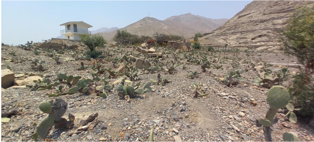
Foto 04: vista del Sitio Arqueológico Quebrada Higerón Sector II, y la presencia de tunales en zona arqueológico, poniendo en riesgo de colapso algunas estructuras prehispánicas.