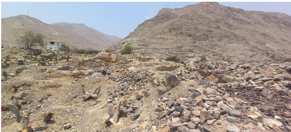
Foto 06: vista de las estructuras de planta cuadrangular como depósitos que se ubican al interior de la zona arqueológica y se encuentran rodeadas por sembríos de tunales, verificando un riesgo probable de afectación.