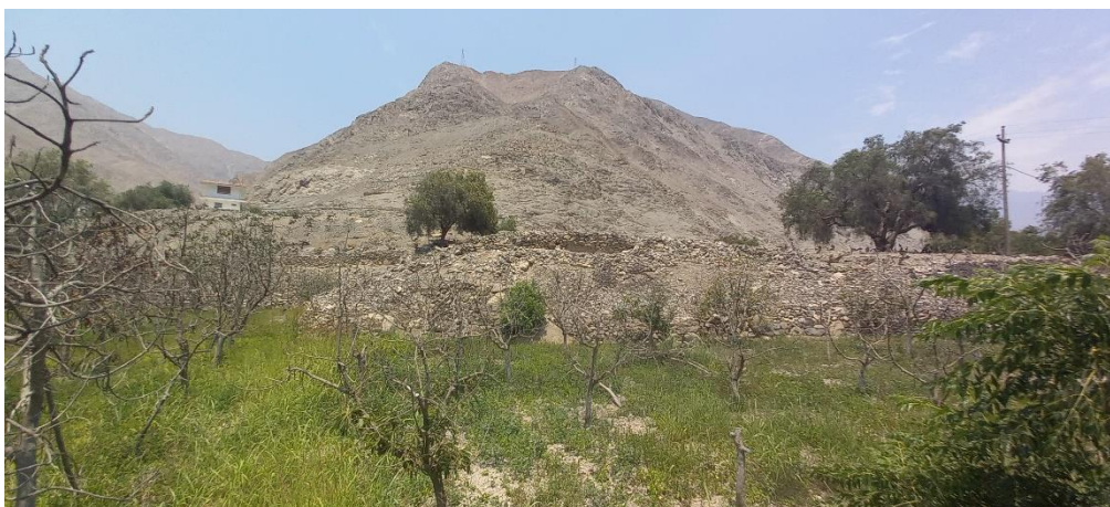
Foto 03: vista de estructuras prehispánicas que forman del Sitio Arqueológico Quebrada Higuieron II, rodeado de sembríos, poniendo en riesgo las estructuras.