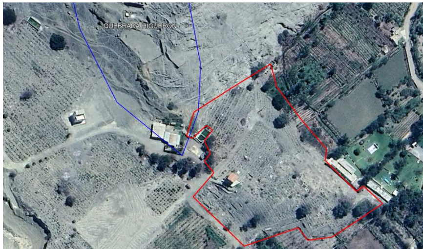
Foto 02: vista del Sitio Arqueológico Quebrada Higuieron Sector II, y la zona con propuesta poligonal (rojo) para protección provisional, por riesgo probable de afectación.