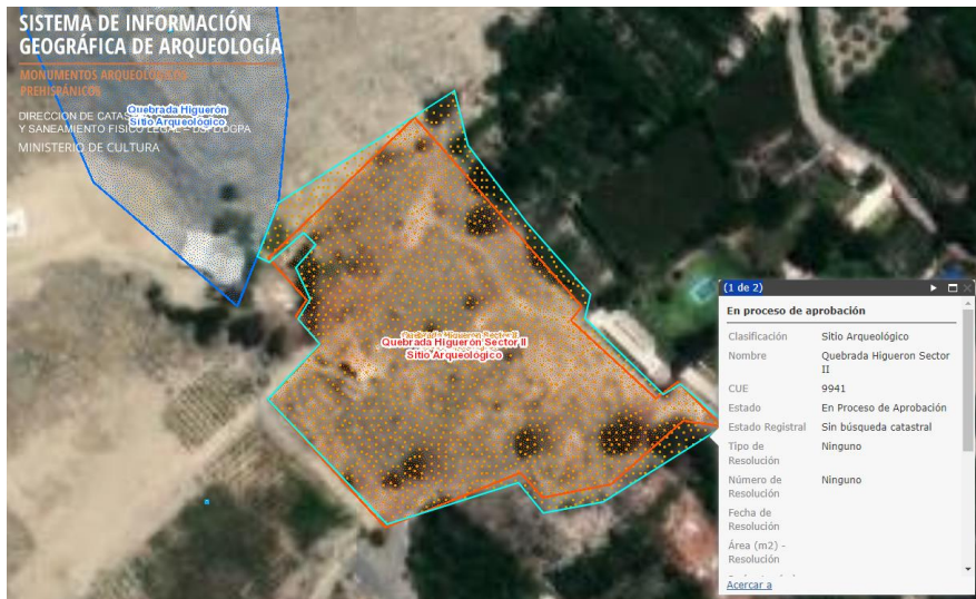
Foto 01: vista del Sitio Arqueológico Quebrada Higuieron Sector II, ubicado en el distrito de San Antonio, provincia de Cañete, departamento de Lima.