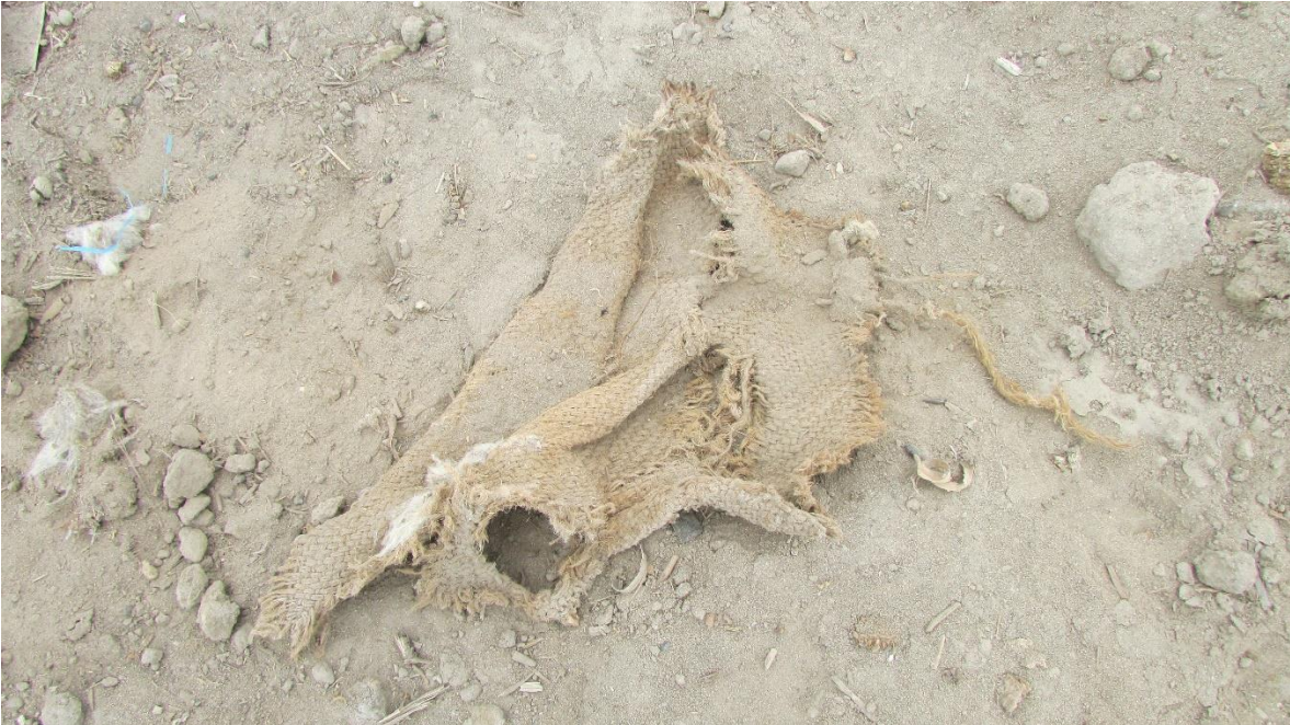
Figura 05. Fragmento de textil.