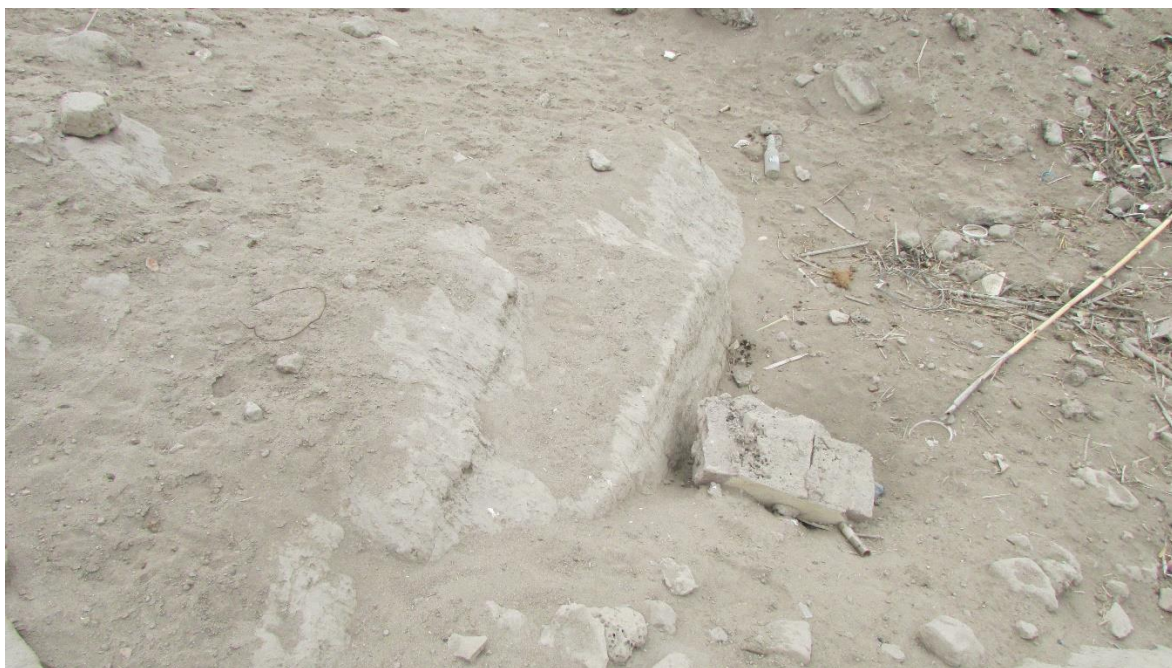
Figura 07. Muros de tapiales enterrados.

Dirección Desconcentrada de Cultura de Ica