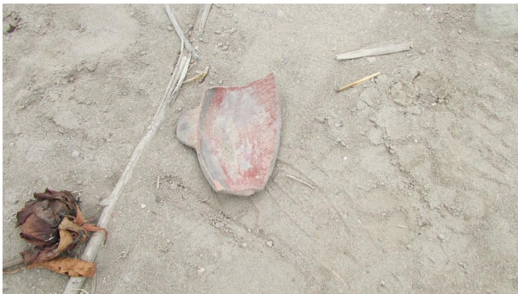
Figura 04. Fragmento de plato de filiación cultural Intermedio Tardío.