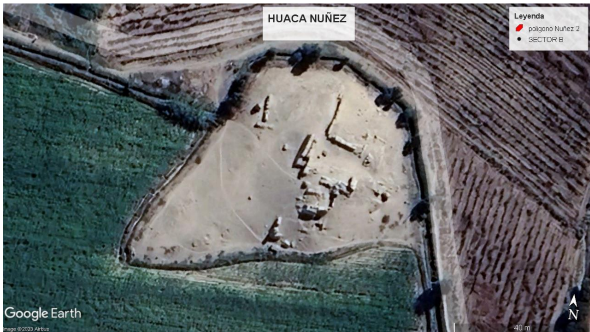
Figura 02. Imagen satelital de Huaca Nuñez sector B, se observa muros de tapiales con diferentes orientaciones, este sitio está rodeado por áreas de cultivo.