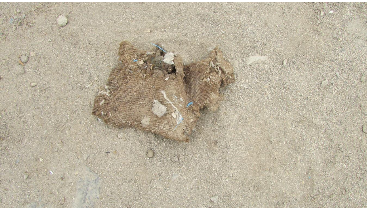
Figura 06. Fragmento de textil de fibra animal.