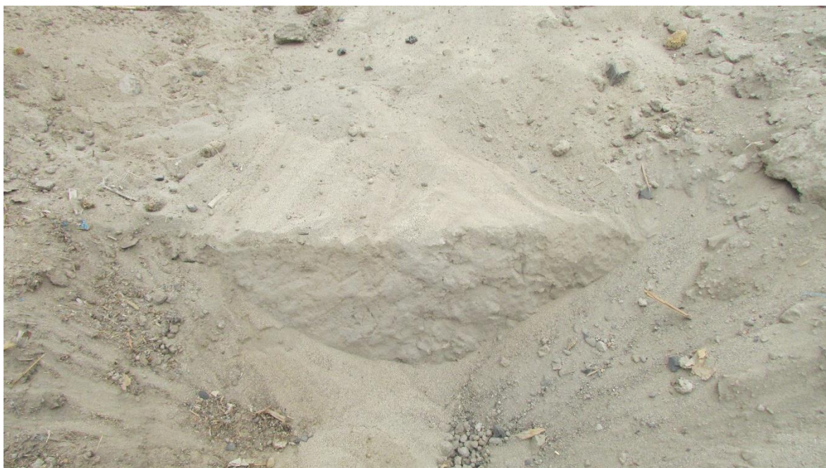
Figura 03. Muro de tapial enterrado.