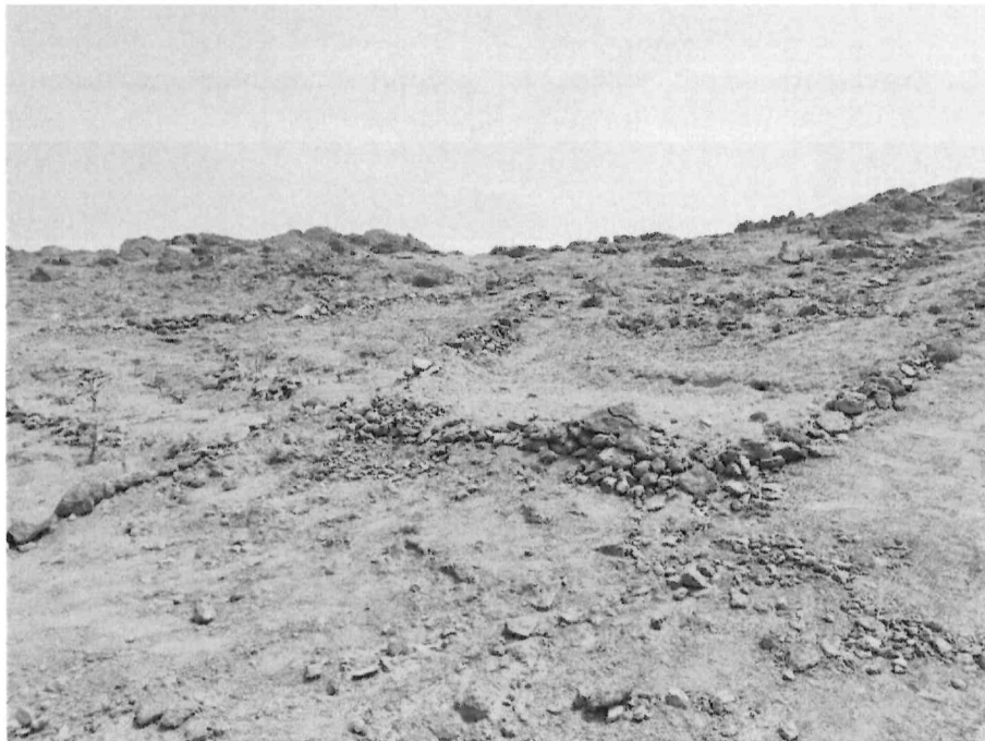
Vista general del área donde se realizaron las plantaciones de cactáceas y sábilas.