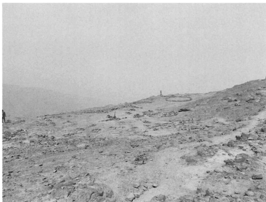
Vista general del Sitio Arqueológico Cerro Chaclacayo 1, en él se puede apreciar caminos que lo atraviesan.