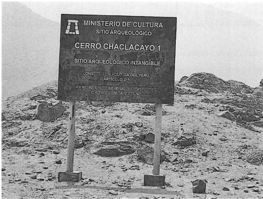
Vista del letrero de señalización provisional instalado en el extremo norte del sitio arqueológico.

Dirección General de Defensa del Patrimonio Cultural