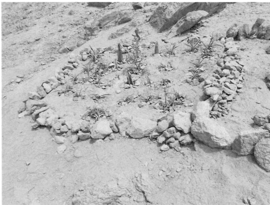
Vista del detalle de las plantaciones de cactáceas y otros.