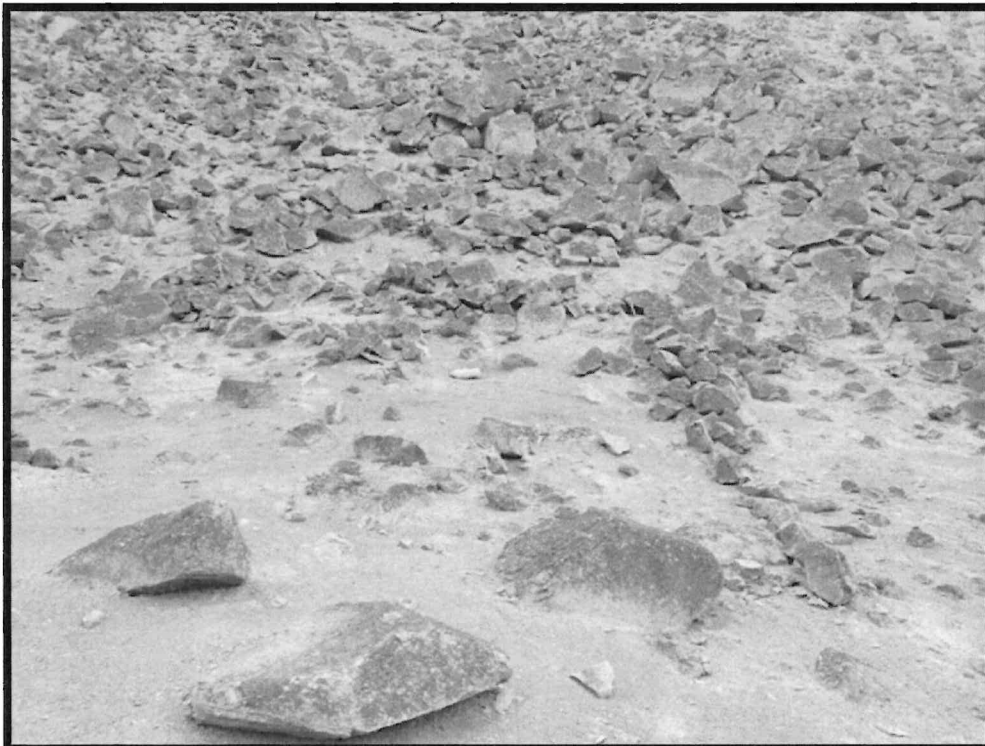
Imagen N ° 8: Sitio Arqueológico El Arenal. Vista panorámica de una estructura de forma trapezoidal en mal estado de conservación se puede apreciar los alineamientos de los muros.