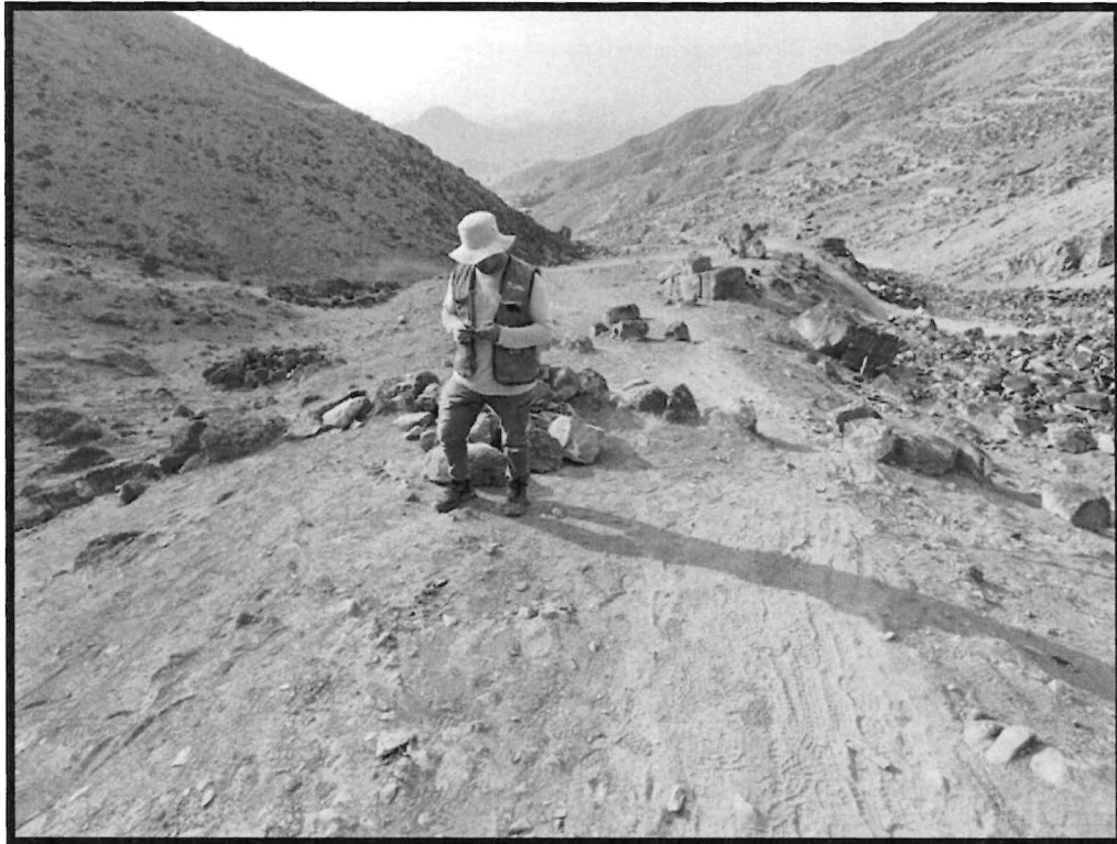
Imagen N ° 3: Sitio Arqueológico El Arenal. Vista panorámica del uso indebido donde practican el deporte de ciclismo cerca a las estructuras, ubicadas al interior del sitio arqueológico.