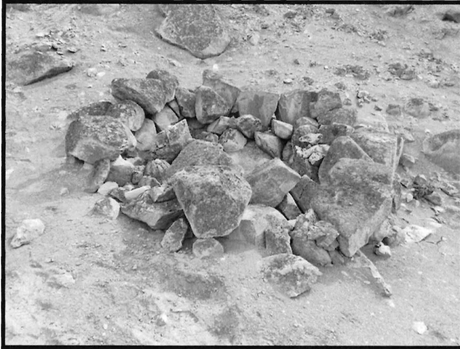
Imagen N ° 5: Sitio Arqueológico El Arenal. Vista panorámica de la estructura circular de 1.5 m de diámetro.