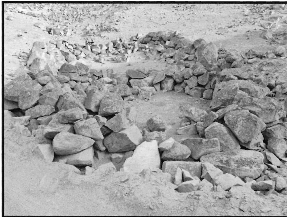
Imagen N ° 6: Sitio Arqueológico El Arenal. Vista panorámica de dos estructuras adosadas la primera de forma cuadrangular de 5 m de lado aprox. Y la segunda de forma circular de 3.5 m de diámetro aprox.