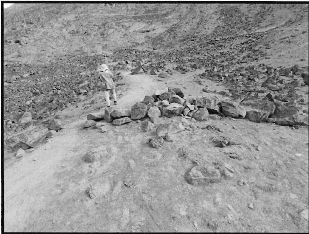
Imagen N ° 2: Sitio Arqueológico El Arenal. Vista panorámica de las huellas del tránsito de bicicleta.