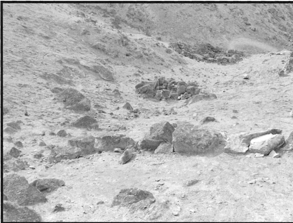
Imagen N ° 4: Sitio Arqueológico El Arenal. Vista panorámica del alineamiento de muro orientado de noreste a suroeste.