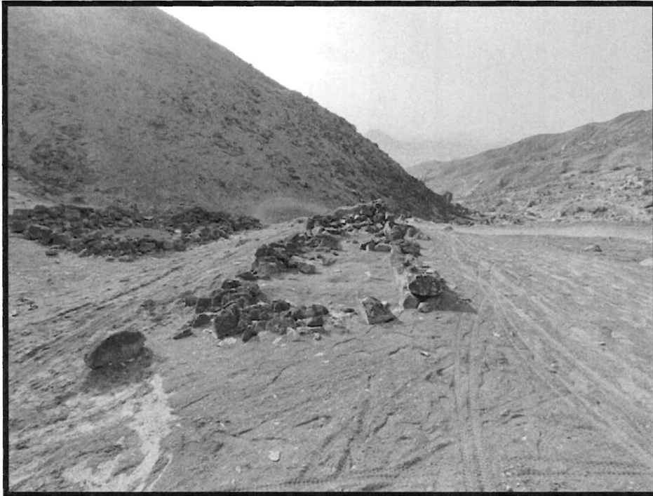
Imagen N ° 7: Sitio Arqueológico El Arenal. Vista panorámica de una estructura de forma trapezoidal orientado de suroeste a noreste en la base tiene una longitud aprox. de 3m, además véase que cerca de la estructura practican ciclismo donde se observan las huellas de bicicletas.