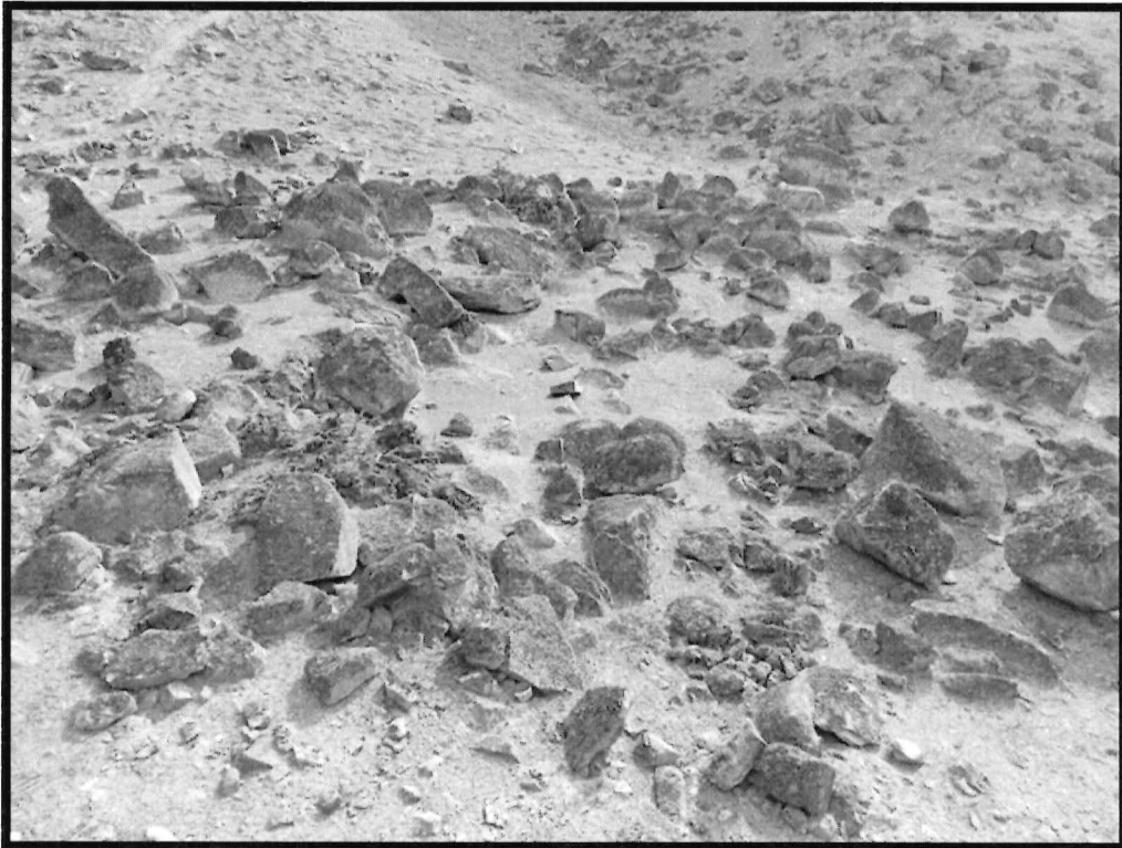
Imagen N° 1: Sitio Arqueológico El Arenal. Vista panorámica de la Estructura A, semi circular de aprox. 2 de diámetro, hacia el lado posterior de la estructura se observan las huellas de bicicleta.