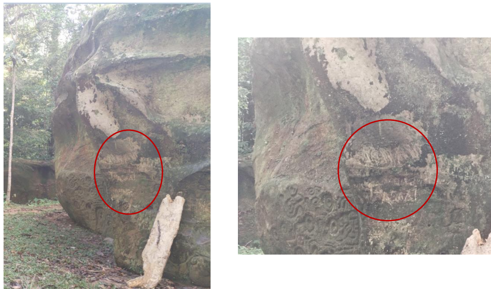
Vista de escritos e incisiones modernas sobre los petroglifos