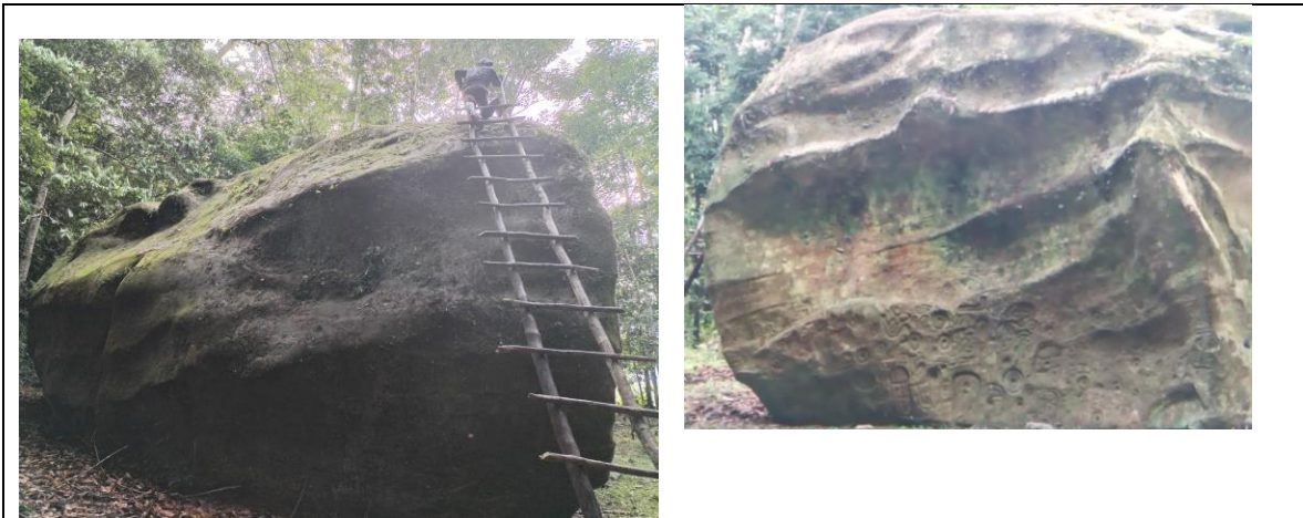
Vista estado actual del petroglifo principal "Casa de Cumpanamá"