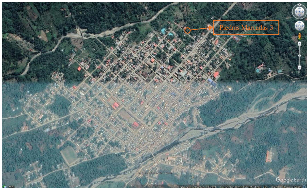
Imagen 02: Emplazamiento del Paisaje Arqueológico de "Piedras Marcadas 3" al noreste de la plaza principal del distrito de Santa Rosa.