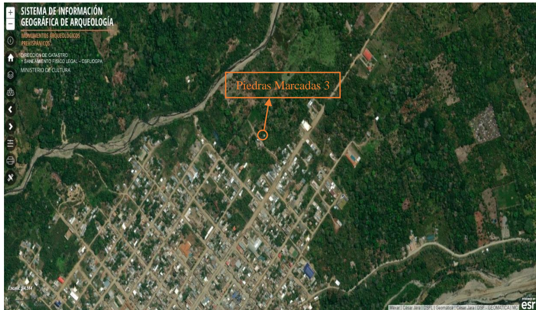
Imagen 01: Ubicación del Paisaje Arqueológico de "Piedras Marcadas 3". Nótese su falta de registro en el Sistema de Información Geográfica de Arqueología (SIGDA) del Ministerio de Cultura.