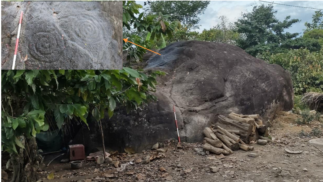
Imagen 05: Petroglifos tallados sobre la superficie lateral del soporte pétreo. Nótese el diseño de doble espiralado.

"Decenio de la igualdad de oportunidades para mujeres y hombres" "Año del bicentenario del Perú: 200 años de independencia"