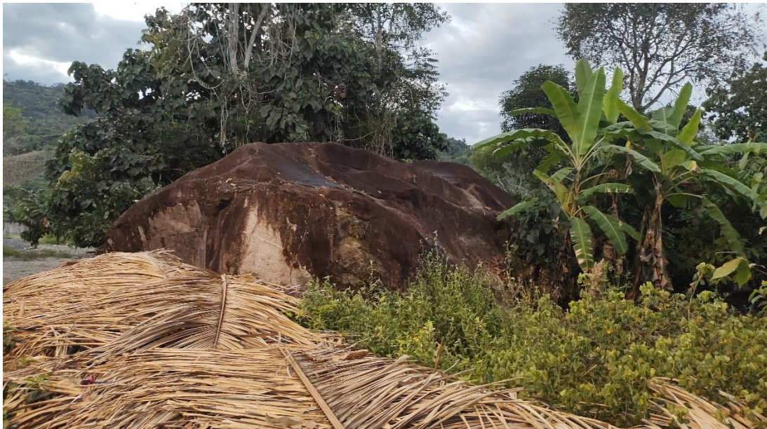
Imagen 06: Evidencia pétreo circunscrita por campos de cultivo y vía de acceso. Nótese el estado de conservación del petroglifo.