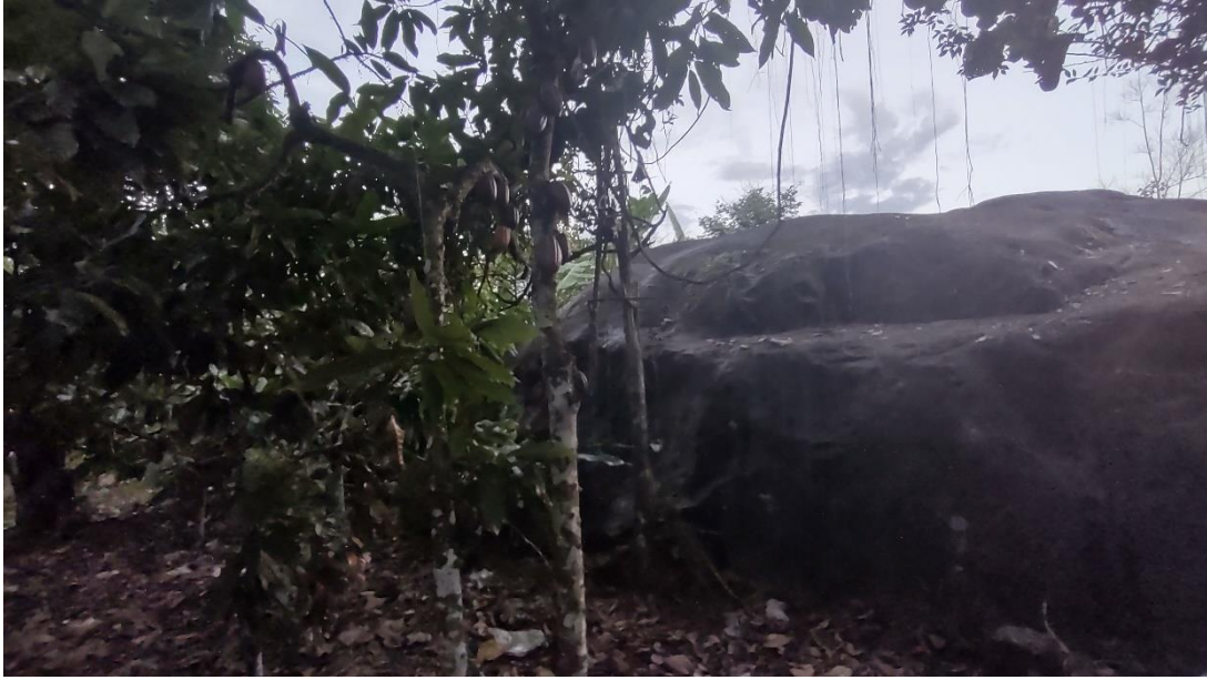
Imagen 07: Cara lateral noroeste del soporte pétreo. Nótese la gran cantidad de ramas adosadas a ella.

"Decenio de la igualdad de oportunidades para mujeres y hombres" "Año del bicentenario del Perú: 200 años de independencia"