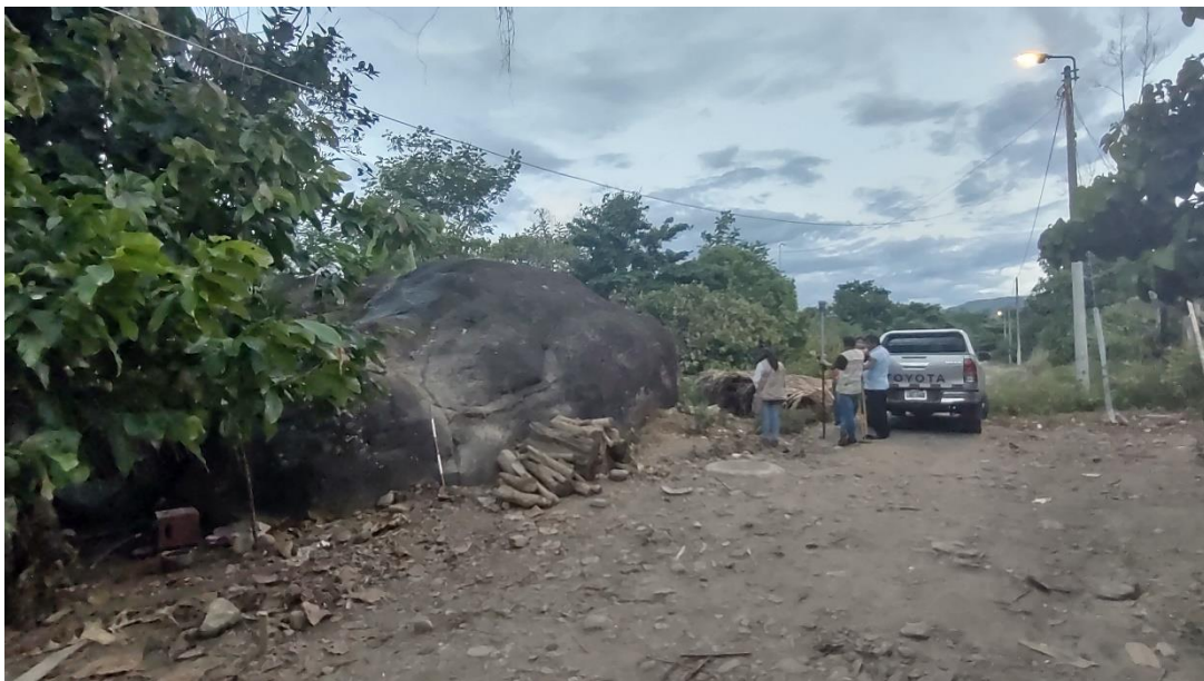
Imagen 04: Soporte pétreo ubicado junto al Jr. Los Nogales y sitiado por campos de cultivo. Nótese el acopio de troncos al lado noroeste del petroglifo.