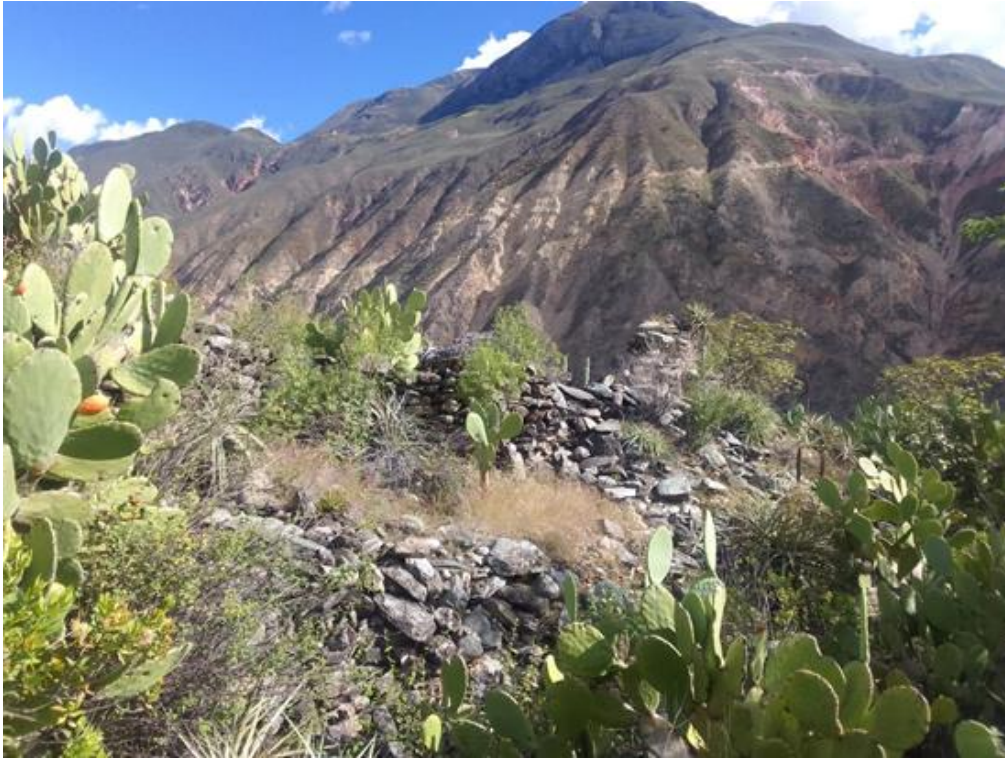
Fig. 04. Vista de las evidencias prehispánicas al entrar por la parte inferior del área.

"Decenio de la Igualdad de Oportunidades para Mujeres y Hombres" "Año de la unidad, la paz y el desarrollo" "Huñulla, hawka kawsakuypi wiñarina wata" / "Mayacht'asiña, sumankaña, nayraqataru sarantañataki mara" "Osarensi akametsatabakantajeityari antantayetantyarori kametsari"