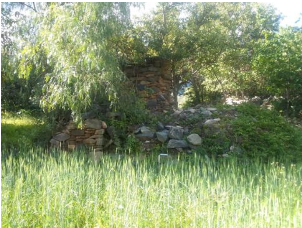
Fig. 03. Vista de un recinto conservado.