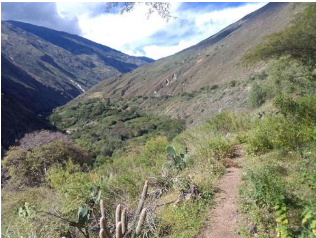
Fig. 05. Vista del acceso al sitio arqueológico en la parte noroeste.