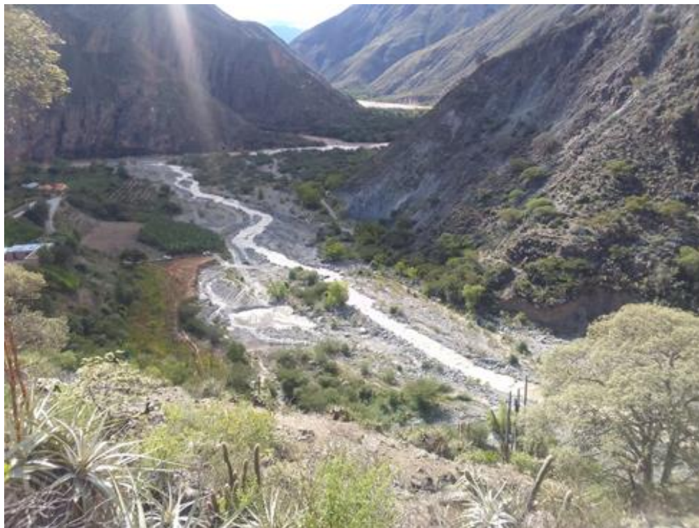
Fig. 07. Vista desde el sitio arqueológico, se puede ver a la localidad de Colca con la apertura de una trocha inconclusa.