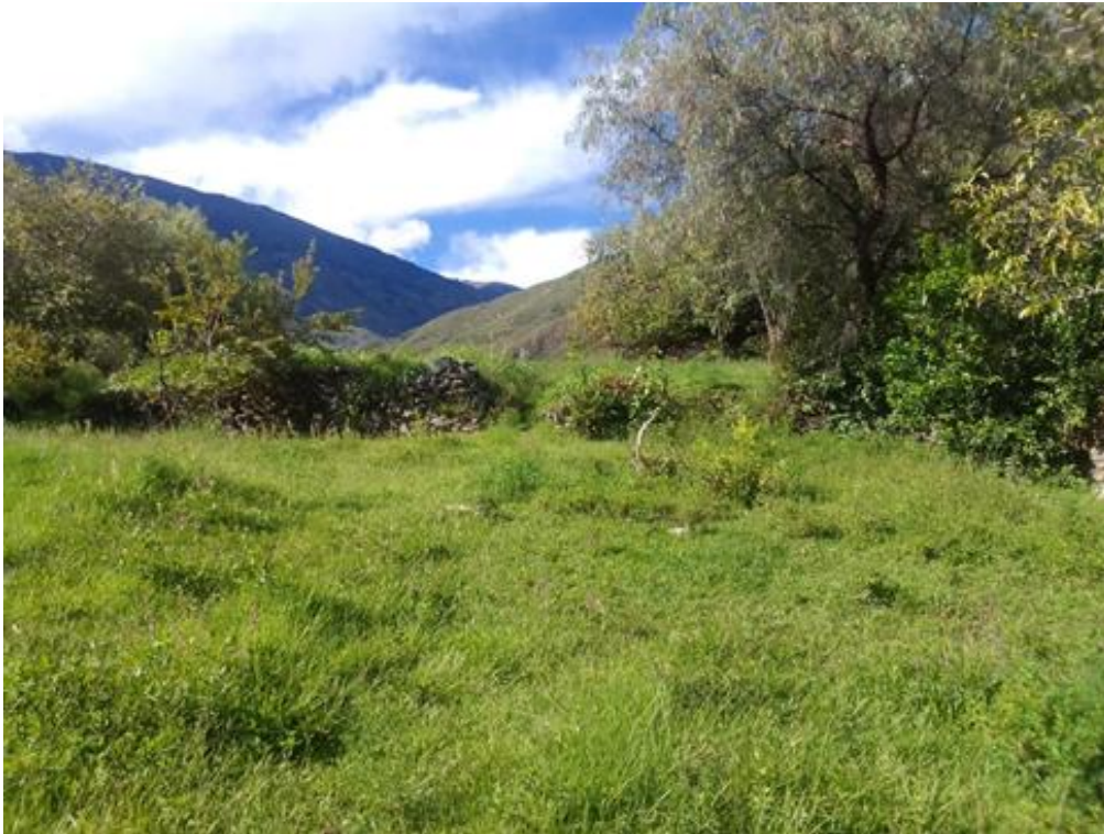
Fig. 02. Vista de los muros arqueológicos que se encuentran cubiertas por la vegetación.

"Osarensi akametsatabakantajeityari antantayetantyarori kametsari"