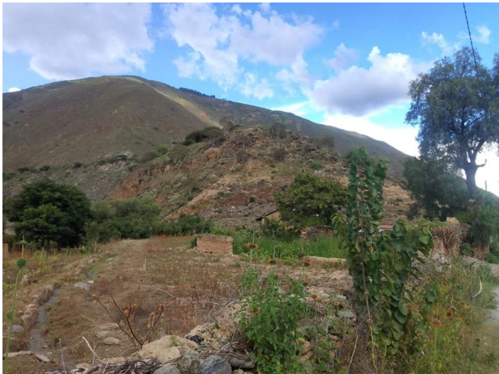
Fig. 01. Vista del sitio arqueológico desde la localidad de Colca, a la fecha de la inspección no se ha determinado afectación alguna por una trocha carrozable, pero si afectaciones por la agricultura.