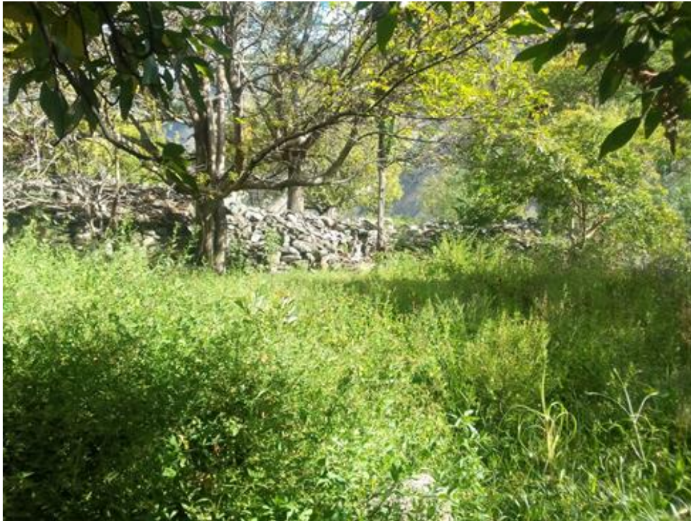
Fig. 06. Vista de los muros arqueológicos que se encuentran cubiertas por la vegetación.

"Osarensi akametsatabakantajeityari antantayetantyarori kametsari"