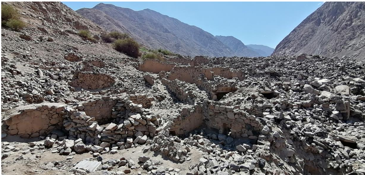
Foto 5. Sitio Arqueológico Minay. Vista de las estructuras arqueológicas presentes en el sector noreste del monumento arqueológico prehispánico.