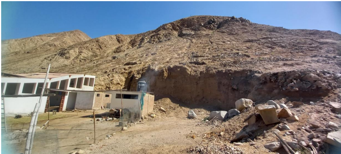
Foto 2. Sitio Arqueológico Minay. Vista del área ubicada en la parte baja de la ladera del cerro, donde se aprecia la expansión de la comunidad hacia las faldas del cerro Minay.