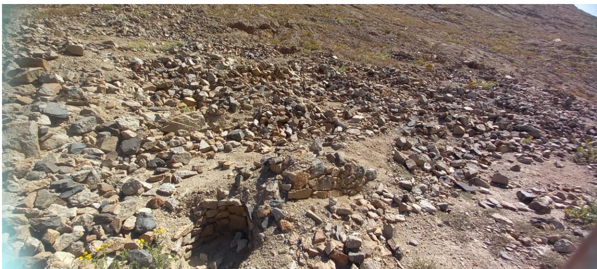
Foto 3. Sitio Arqueológico Minay. Vista de las estructuras arqueológicas presentes en la ladera del cerro Minay.