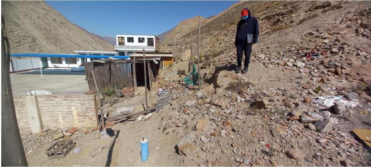
Foto 1. Sitio Arqueológico Minay. Vista del área ubicada en la parte baja de la ladera del cerro, donde se aprecia la presencia de hitos de delimitación. Nótese la proximidad de las estructuras modernas al monumento arqueológico prehispánico.