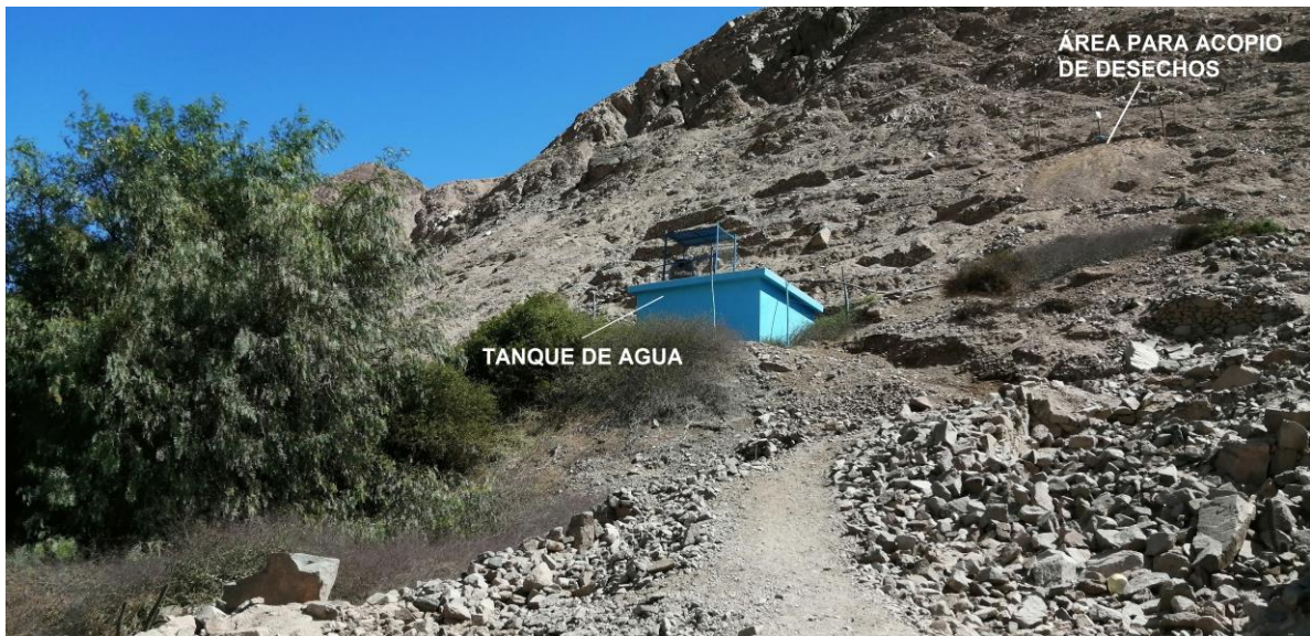
Foto 4. Sitio Arqueológico Minay. Vista de las construcciones modernas al interior del área arqueológica, nótese el área utilizada para el acopio de desechos por parte de la comunidad.