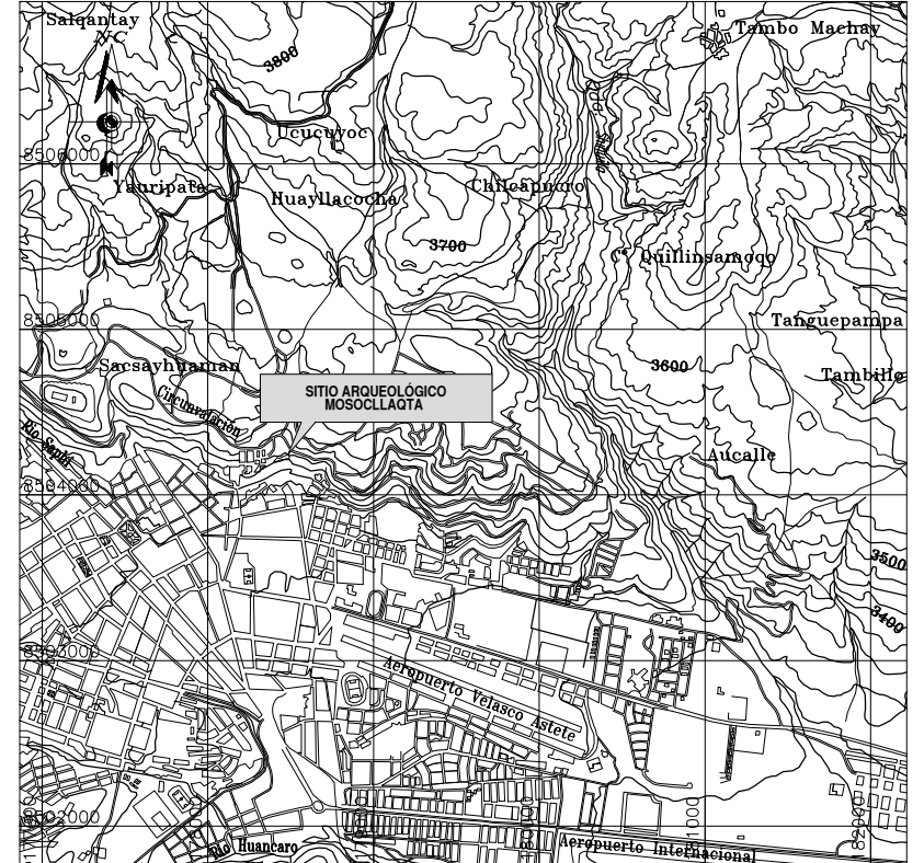
PLANO DE UBICACIÓN ESCALA: 1/50,000