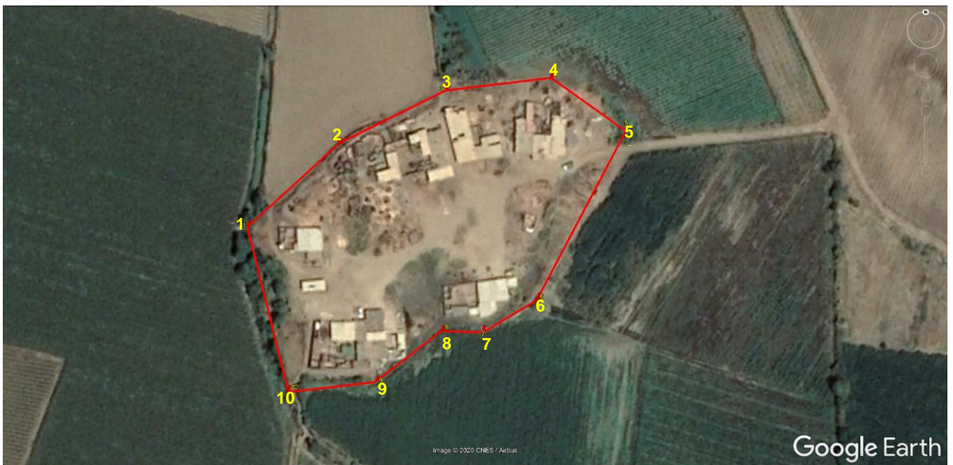
Fig. 3: Sitio Arqueológico Huaca La Pajilla o Sitio Arqueológico VV. 93-3:3. – Vértices de referencia.