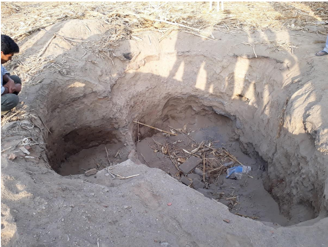
Fig. 5: Sitio Arqueológico Huaca La Pajilla o Sitio Arqueológico VV. 93-3:3. – Vista Oeste-Este de la excavación clandestina en cuyo interior se aprecia cerámica prehispánica fragmentada, perfiles culturales alterados, restos malacológicos de actividad prehispánica y arquitectura prehispánica.