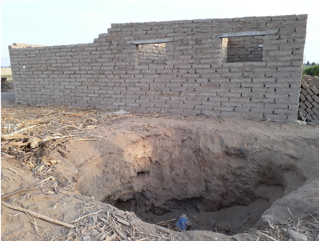
Fig. 4: Sitio Arqueológico Huaca La Pajilla o Sitio Arqueológico VV. 93-3:3. – Vista Este-Oeste de la cima de la Sitio Arqueológico donde se aprecia una excavación clandestina que sirvió para extraer tierra para fabricar los adobes modernos para las paredes de la vivienda construida.