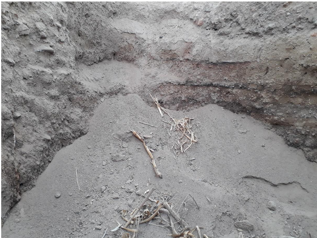
Fig. 7: Sitio Arqueológico Huaca La Pajilla o Sitio Arqueológico VV. 93-3:3. – Vista en detalle de la excavación clandestina en cuyo interior se aprecia cerámica prehispánica fragmentada, perfiles culturales alterados, restos malacológicos de actividad prehispánica y arquitectura prehispánica.