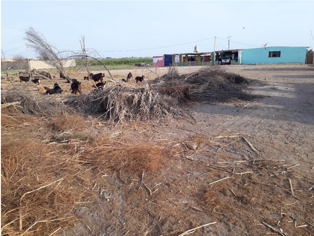
Fig. 8: Sitio Arqueológico Huaca La Pajilla o Sitio Arqueológico VV. 93-3:3. – Vista de la parte superior del Sitio Arqueológico donde se aprecia animales y forraje (alimento para animales).