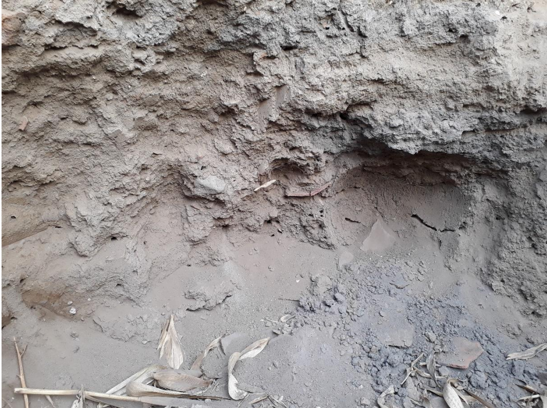
Fig. 6: Sitio Arqueológico Huaca La Pajilla o Sitio Arqueológico VV. 93-3:3. – Vista en detalle de la excavación clandestina en cuyo interior se aprecia cerámica prehispánica fragmentada, perfiles culturales alterados y restos malacológicos de actividad prehispánica.