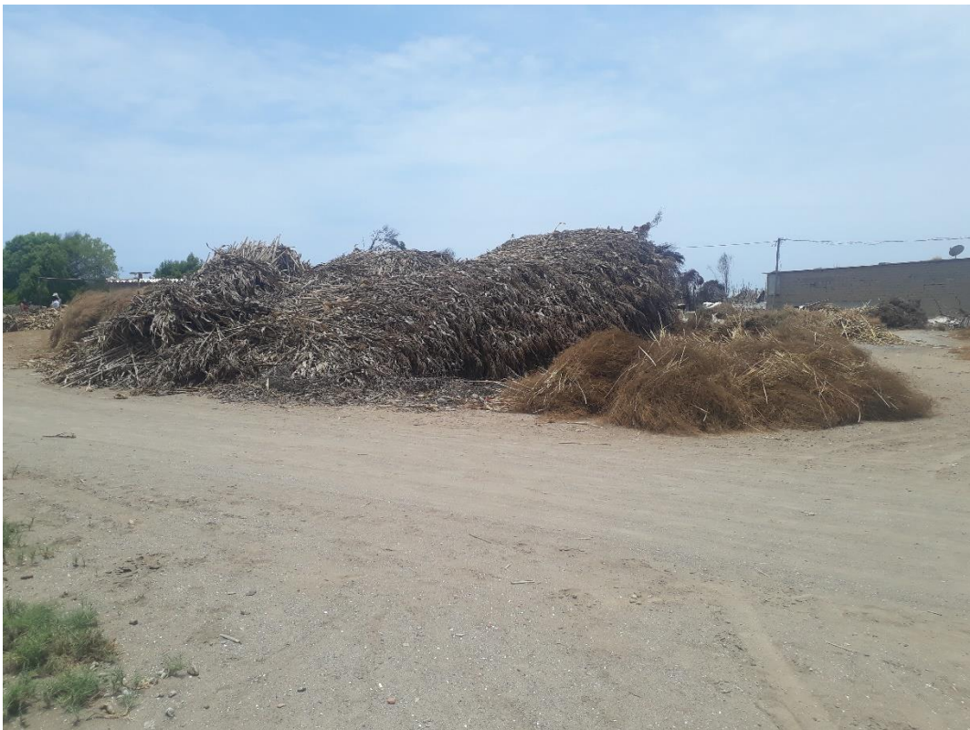
Fig. 9: Sitio Arqueológico Huaca La Pajilla o Sitio Arqueológico VV. 93-3:3. – Otra vista de la parte superior del Sitio Arqueológico donde se aprecia forraje (alimento para animales).