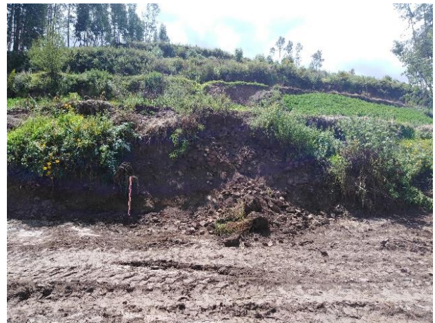
Panorámico del espacio donde se encuentra la sucesión de andenes y los aterrazamientos naturales, que vienen siendo afectados por agentes antrópicos.