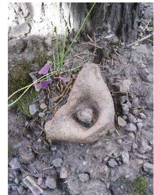
Material cultural representado por fragmentos de cerámica de la época Intermedio Tardío y Horizonte Tardío.