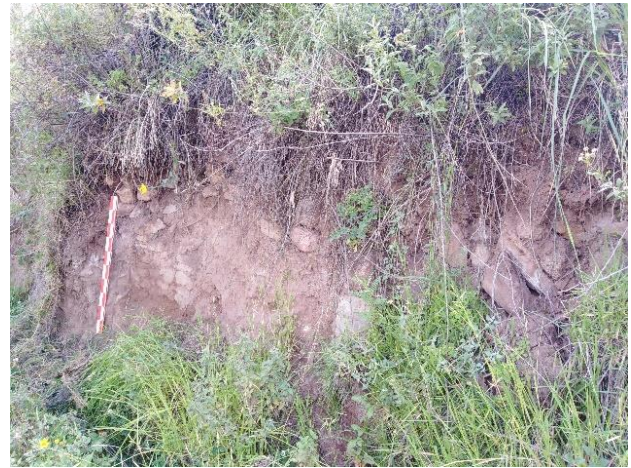
Vista de la Sección del andén de aparejo rústico conformado por piedras medianas y pequeñas, cubierto de vegetación propia de la Zona.