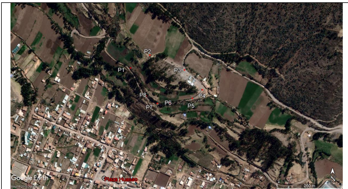
Vista en la imagen Google Earth, de la propuesta del polígono del S.A. de Heramoqo Turpo – Huasao – Oropesa.