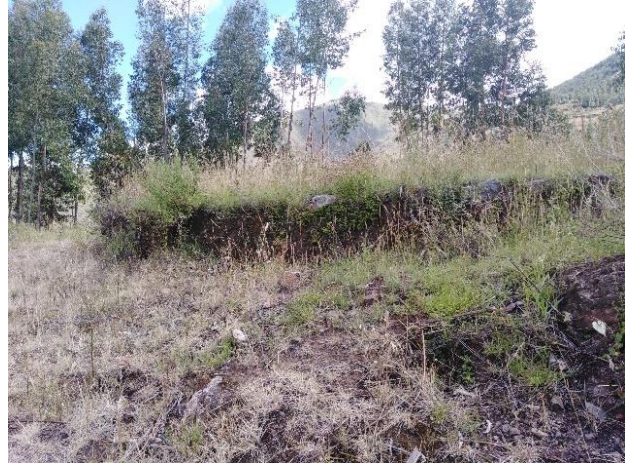
Alineamiento de piedras que configuran la plataforma (Usnho) ubicado en la parte alta de la colina. Sitio Arqueológico de Heramoqo Turpo.