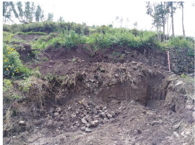
Sección de muro afectado por la apertura de acceso y la ampliación de propiedad.