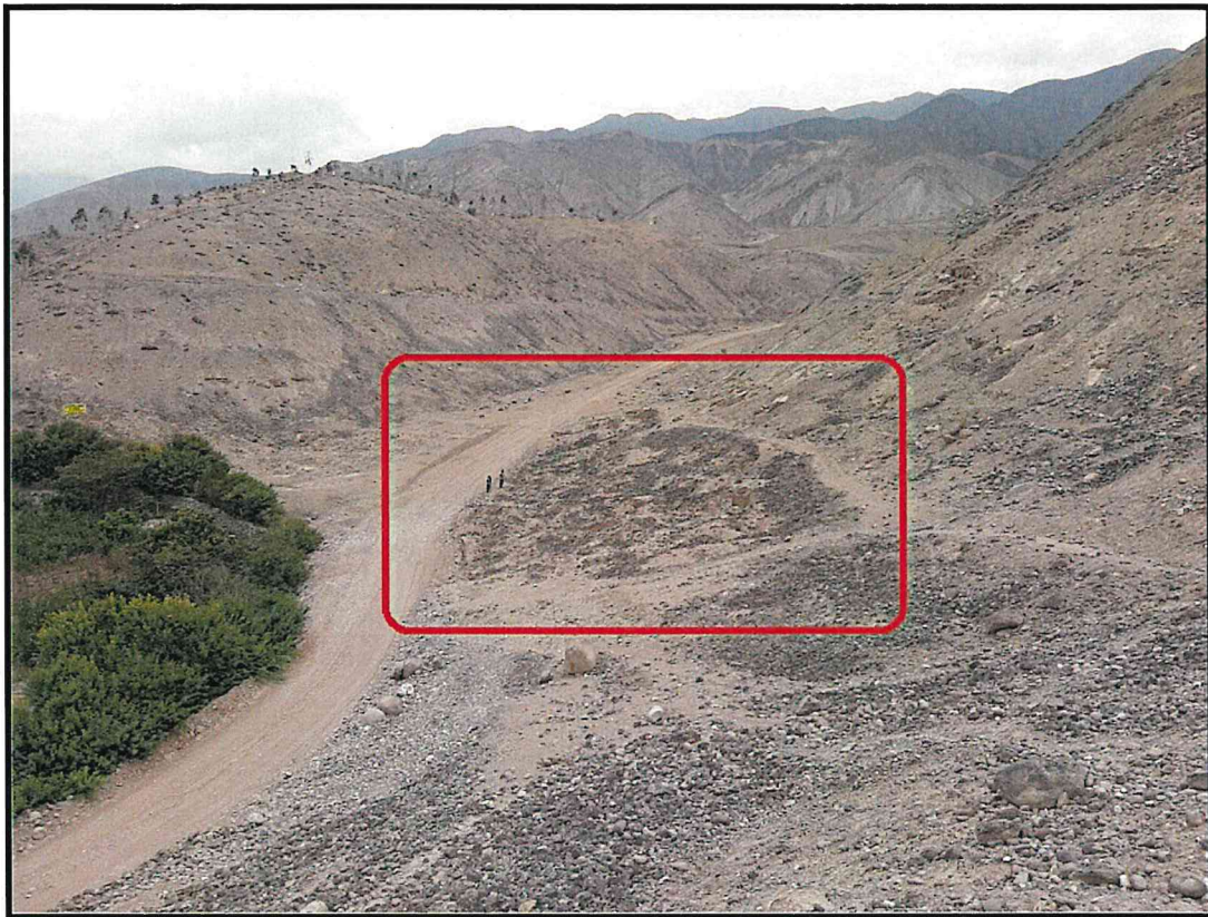
Foto 1: Sitio Arqueológico Quebrada Venado . Vista general del MAP del que se solicita protección, nótese que esta flanqueado por trochas carrozables.