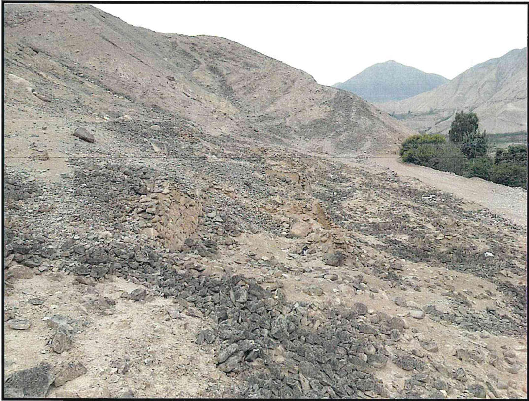
Foto 3: Sitio Arqueológico Quebrada Venado. Vista lateral del MAP donde se observan los muros prehispánicos.

Dirección General de Defensa del Patrimonio Cultural