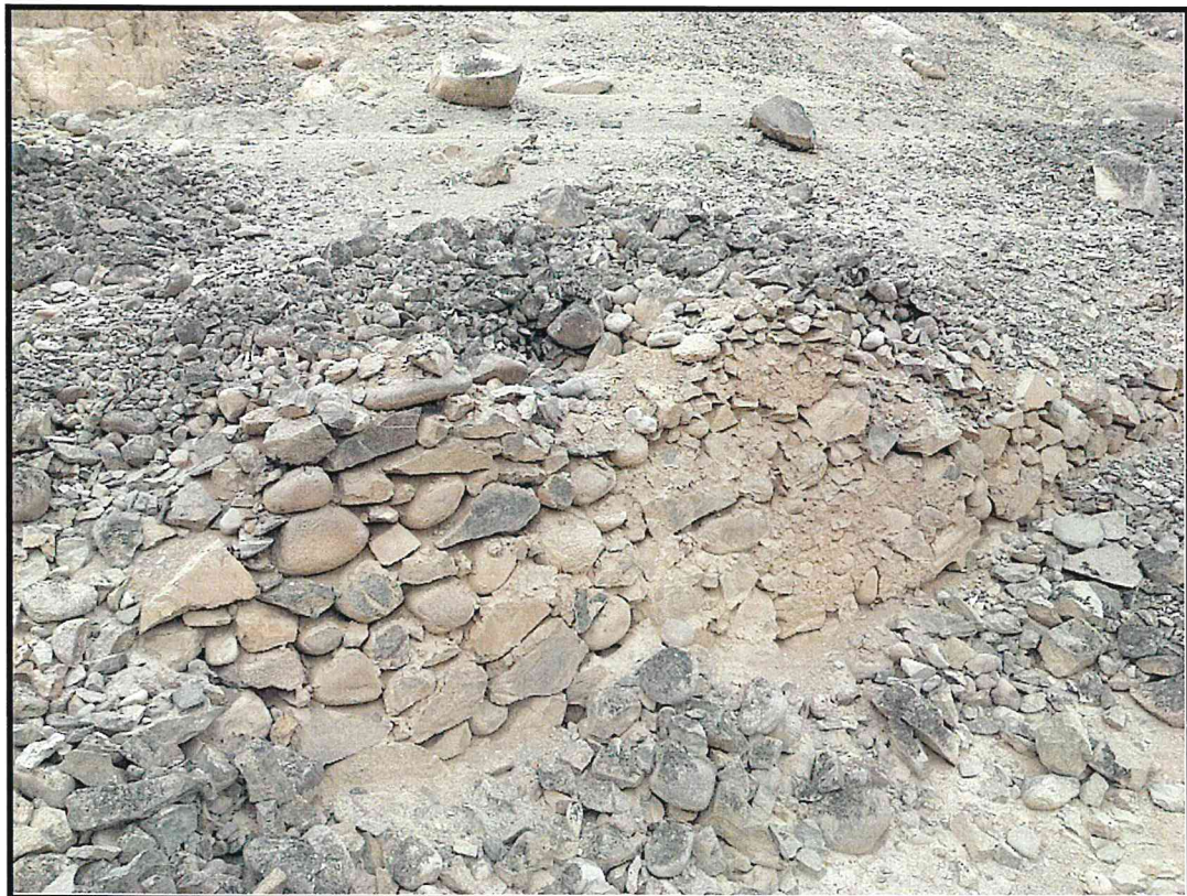
Foto 4: Sitio Arqueológico Quebrada Venado. Detalle de uno de los muros prehispánicos, donde se observa claramente su composición.