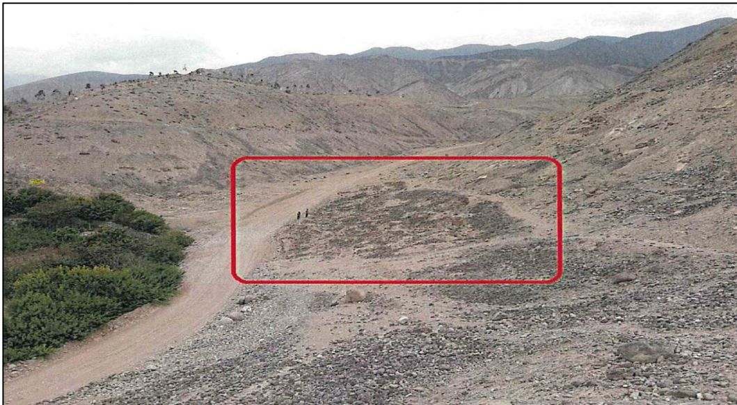
Vista 1: - Tomada del Informe de Inspección N° 001-2020-LVC/DCS/DGPA/VMPCIC/MC, se puede apreciar el sitio arqueológico en relación a las trochas carrozables colindantes.

"Decenio de la Igualdad de Oportunidades para Mujeres y Hombres" "Año de la Universalización de la Salud"