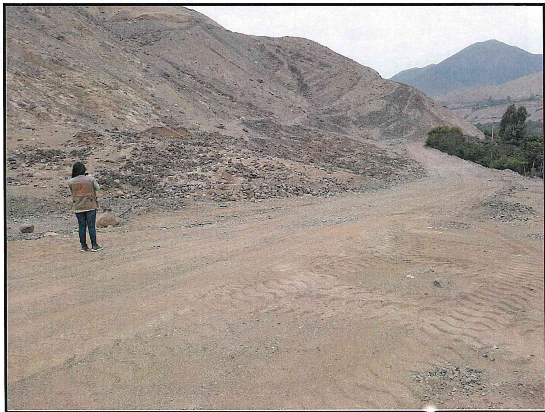
Foto 2: Sitio Arqueológico Quebrada Venado . Vista de la trocha carrozable más próxima a la arquitectura prehispánica, nótese las huellas de vehículos pesados.