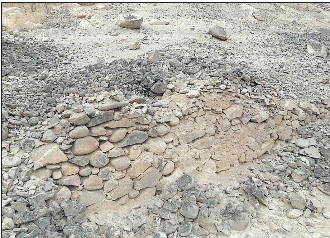
Vista 2: detalle de la arquitectura del sitio.