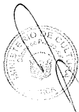
..... Sonia Guillén Oneeglio Ministra de Cultura