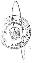
..... Sonia Guillén Oneaglio Ministra de Cultura