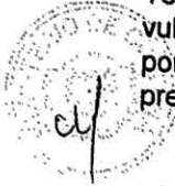
..... Sonia Guillén Oneagüe Ministra de Cultura