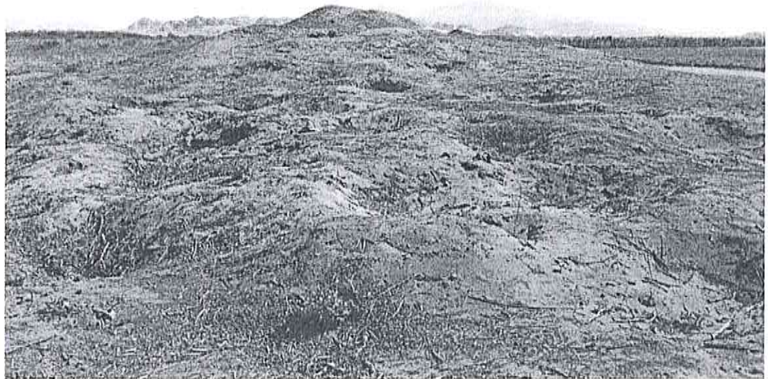
Vista de la estructura preincipal de Huaca el Frejol

Ministerio de Cultura Dirección de Investigaciones Científicas y Museológicas Alondro Rojas López Alondro Rojas López D.N. N. BR-0001