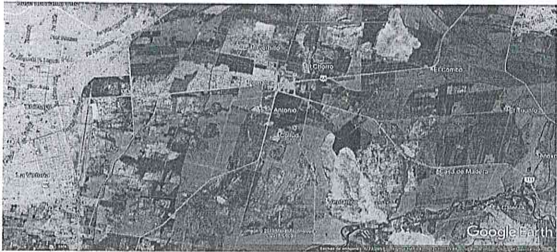
Ubicación de huaca el Frejol en relación a la ciudad de Chiclayo