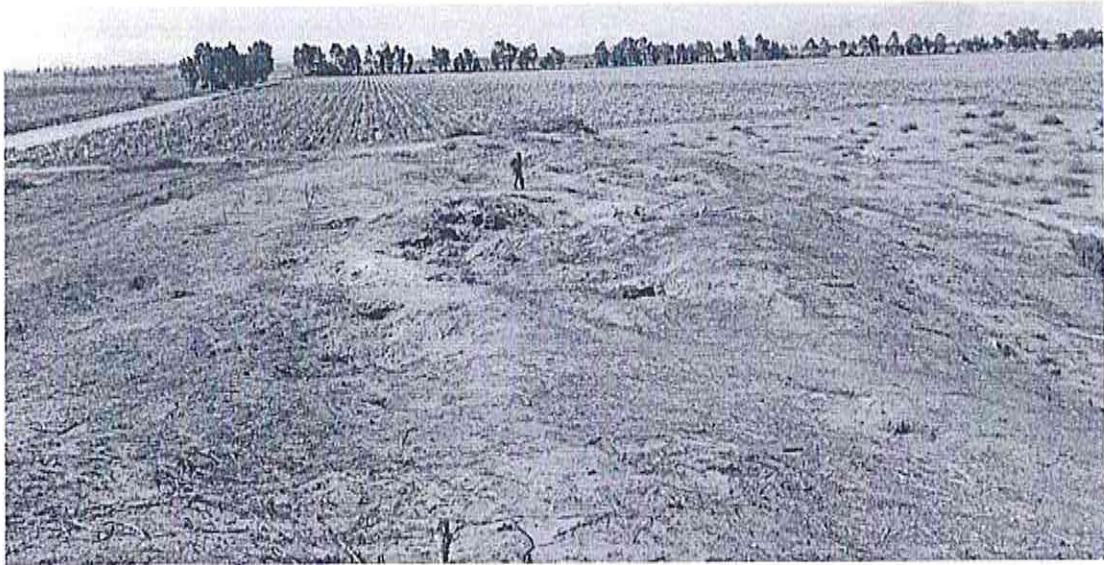
Excavaciones clandestinas (huaqueo) en Huaca El Frejol