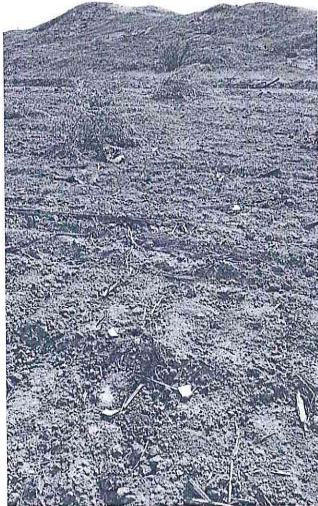
Expansión de la Fornera Agrícola en Huaca el Frejol

Ministerio de Cultura Dirección General de Monumentos y Museos Alfonso Alfonso X. Rojas López I.D.A. N° 00-0201