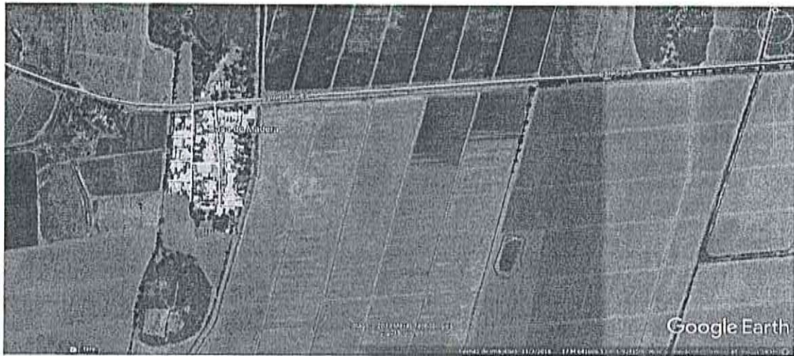
Vista general de Huaca Las El Frejol