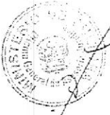
Luis Jaime Castillo Butters Ministro de Cultura