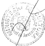
ELENA ANTONIA BURGA CABRERA Viceministra de Patrimonio Cultural e Industrias Culturales (e)