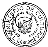
..... ULLA HOLMQUIST PACHAS Ministra de Cultura