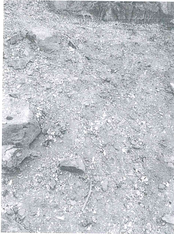
Imagen 3. Vista de superficie con concentración de material malacológico.