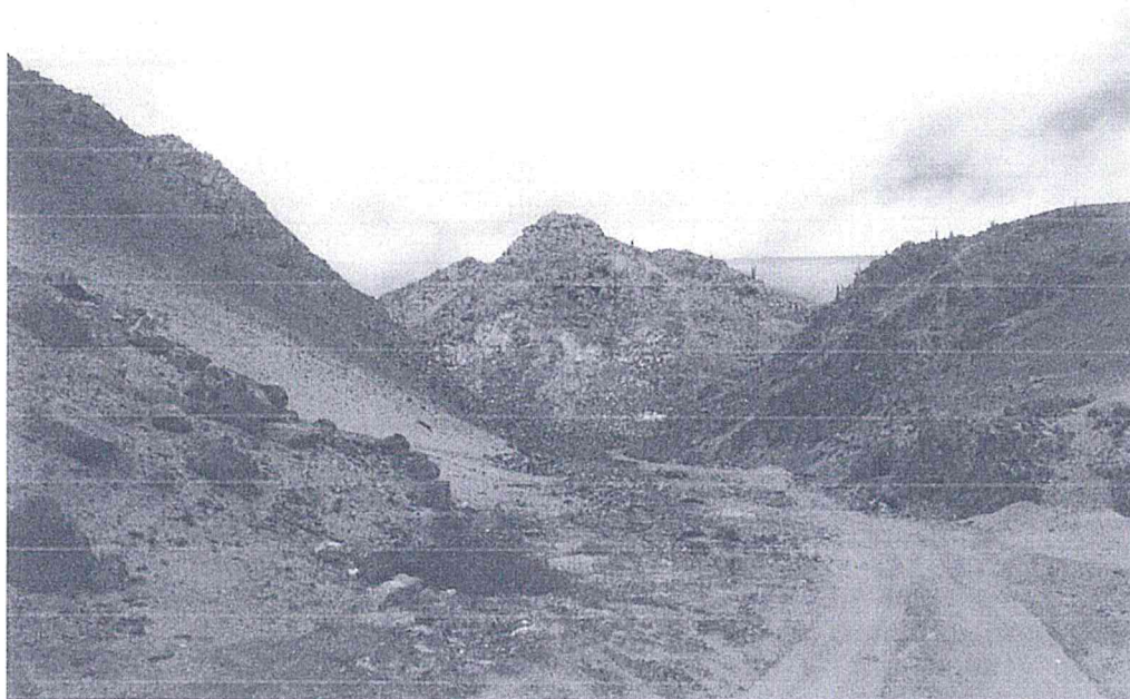
Imagen 1. Ingreso a la Quebrada de los Burros. Vista oeste-este.