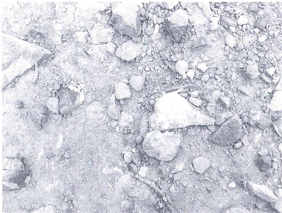
Imagen 6. Fragmentos de cerámica sin decoración.