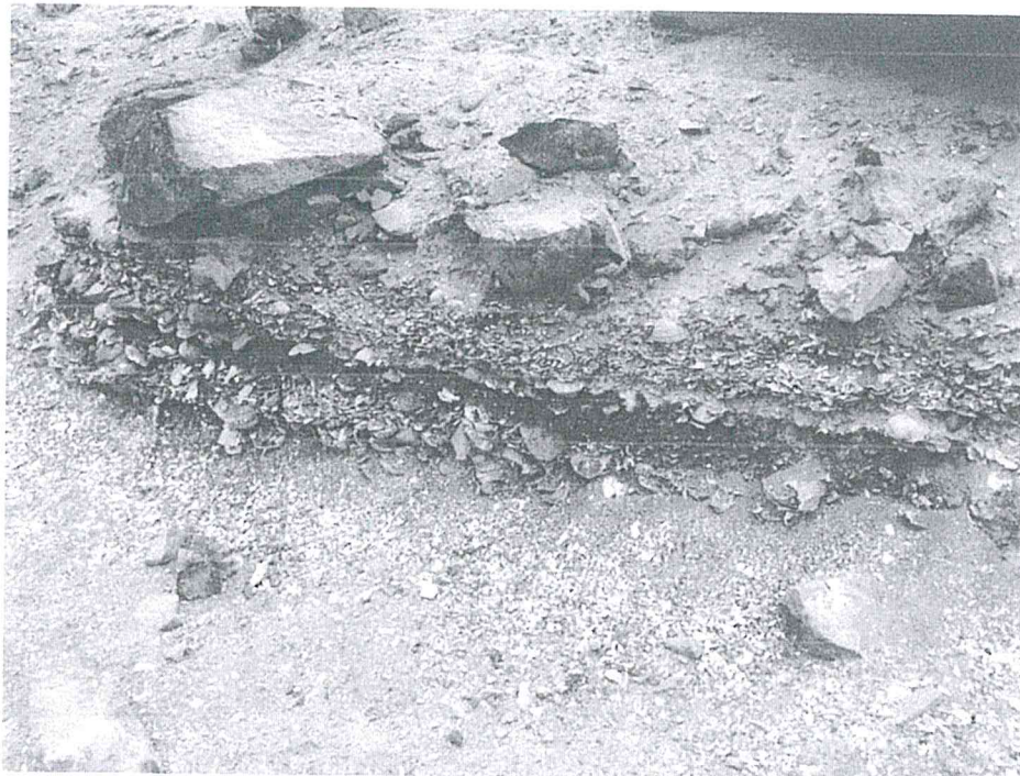
Imagen 4. Perfil con superposición de material malacológico.