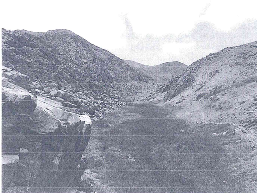
Imagen 2. Vista panorámica de la parte media de la quebrada donde aparece el riachuelo. Vista oeste-este.