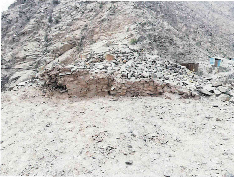
Foto 3. Sitio Arqueológico No Registrado. Vista del área donde se ha aplanado la superficie donde se aprecia un muro de piedra y barro como clara evidencia arqueológica.

Dirección General de Defensa del Patrimonio Cultural