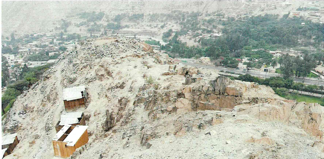
Foto 1. Sitio Arqueológico No Registrado. Vista panorámica del área que presenta evidencia arqueológica en superficie mediante la conformación de una serie de estructuras arquitectónicas y cerámica dispersa.

Las fotos deberán mostrar lo indicado en la valoración cultural (debe observarse de manera evidente la condición de sitio arqueológico del bien):