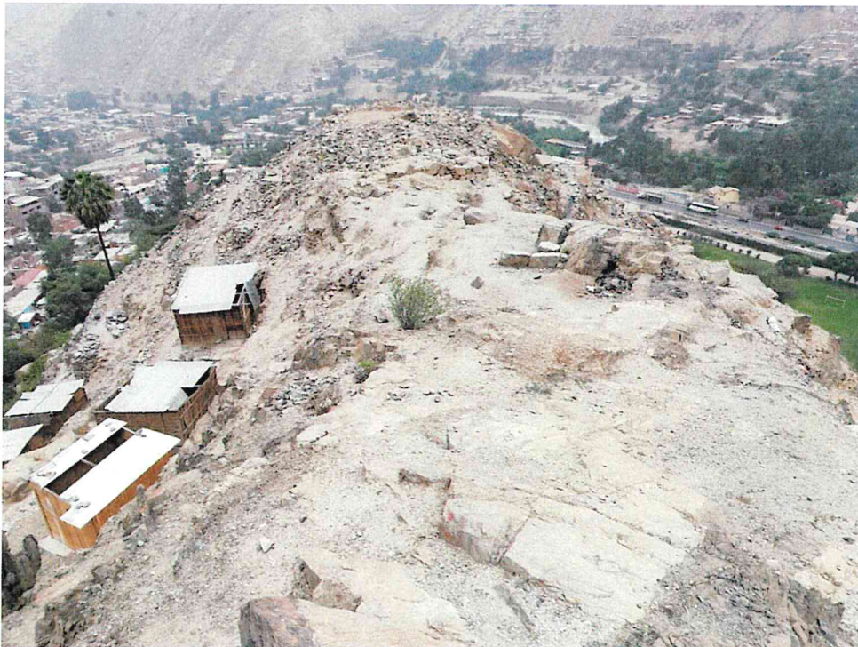
Foto 3. Sitio Arqueológico No Registrado. Vista del área donde se viene extendiendo las estructuras precarias hacia la parte alta de las estribaciones del cerro y por consiguiente muy próximas a evidencia arqueológica en superficie.