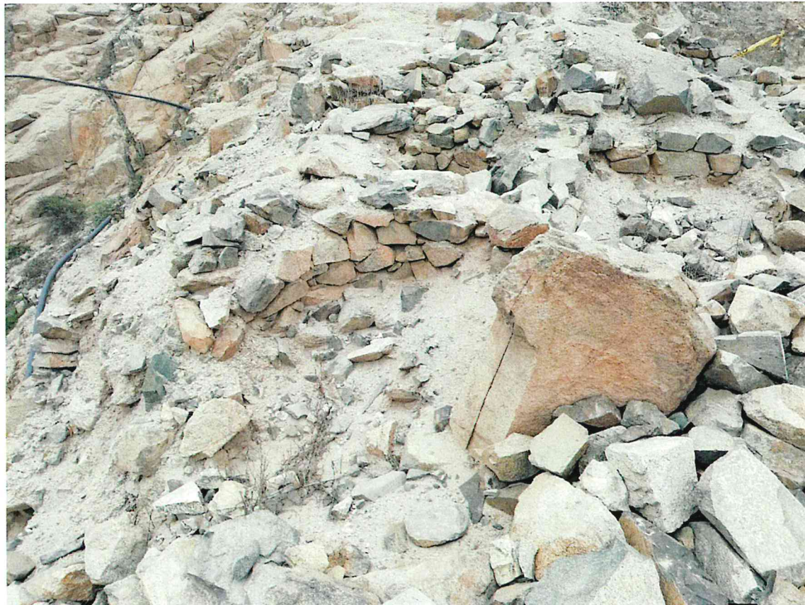
Foto 2. Sitio Arqueológico No Registrado. Vista de uno de los pozos de forma circular conformado por una estructura con mampostería de piedra y barro.