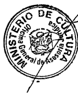
ULLA HOLMQUIST PACHAS Ministra de Cultura