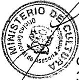
ROGERS MARTIN VALENCIA ESPINOZA MINISTRO DE CULTURA