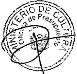
ROGERS MARTIN VALENCIA ESPINOZA MINISTRO DE CULTURA