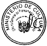
ROGERS MARTIN VALENCIA ESPINOZA MINISTRO DE CULTURA