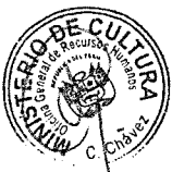
ROGERS MARTIN VALENCIA ESPINOZA MINISTRO DE CULTURA