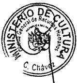
PATRICIA BALBUENA PALACIOS MINISTRA DE CULTURA