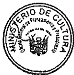
PATRICIA BALBUENA PALACIOS MINISTRA DE CULTURA