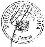
PATRICIA BALBUENA PALAGIOS MINISTRA DE CULTURA