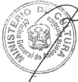
PATRICIA BALBUENA PALACIOS MINISTRA DE CULTURA