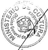
PATRICIA BALBUENA PALACIOS MINISTRA DE CULTURA