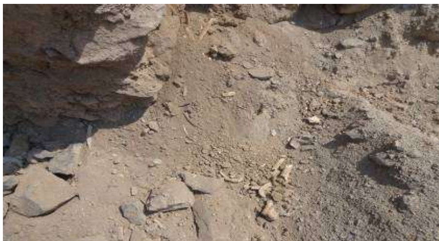
Excavaciones clandestinas recientes