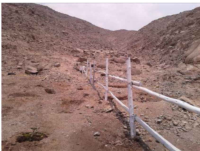
Zona Este del MAP afectada por hoyos para plantar árboles y con cerco restringiendo el acceso.