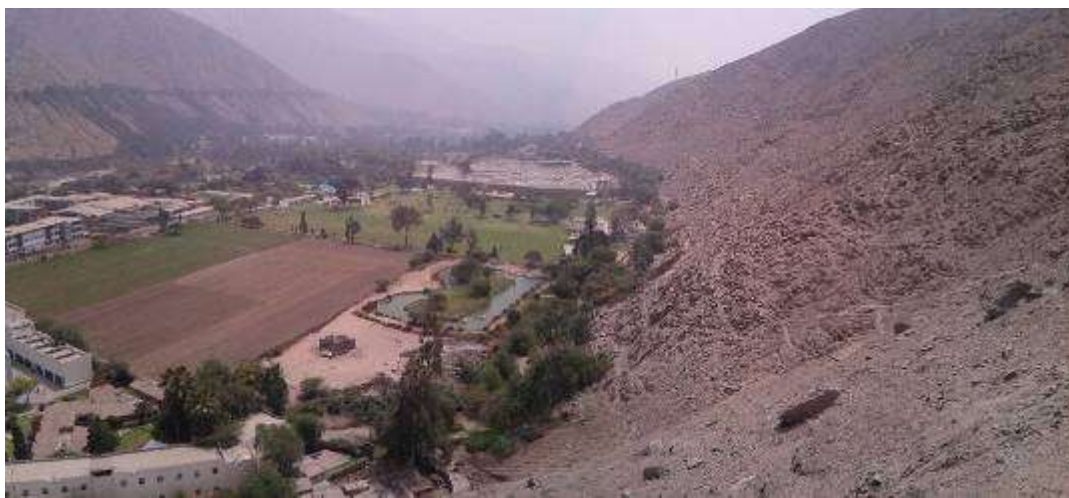
Vista panorámica del Sitio Arqueológico Chacrasana, ubicada en la ladera del cerro del mismo nombre.

Las fotos deberán mostrar lo indicado en la valoración cultural (debe observarse de manera evidente la condición de sitio arqueológico del bien):