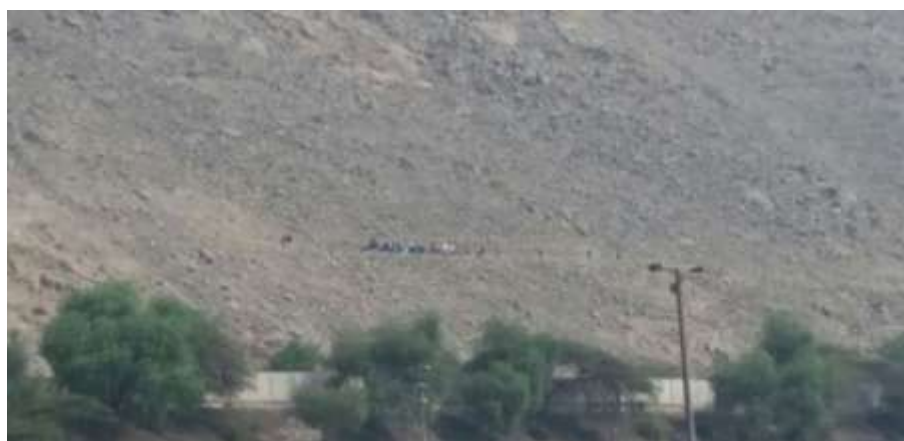
Grupo de pobladores de la Asociación Laderas de Chacrasana, dentro del Sitio Arqueológico, en el momento en que realizan afectaciones a la evidencia.