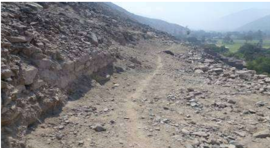
Dstrucción de estructuras para nivelar el terreno y por donde transitan continuamente.