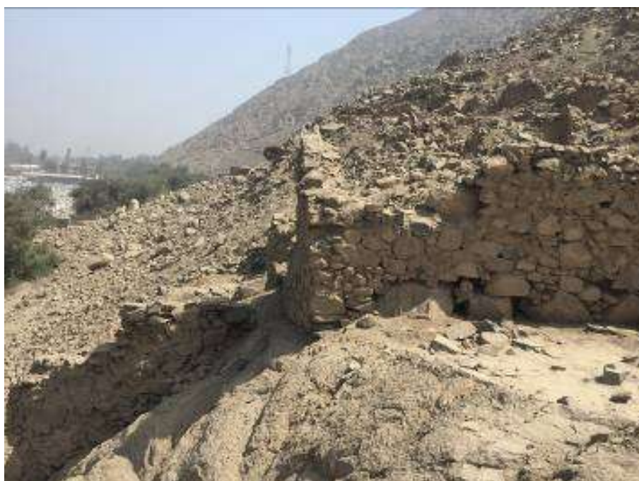
Estructura aterrazada en la parte central del sitio