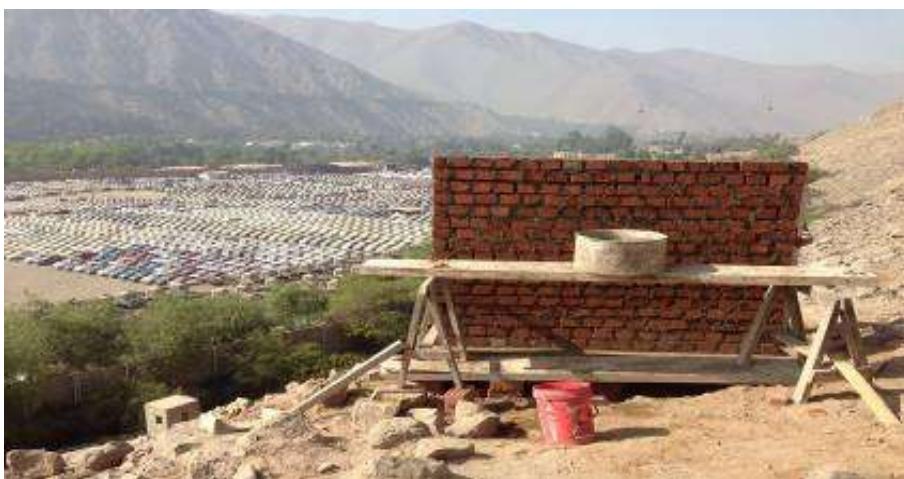
Elaboración del muro de señalización