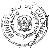
PATRICIA BALBUENA PALACIOS MINISTRA DE CULTURA