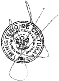
PATRICIA BALBUENA PALACIOS MINISTRA DE CULTURA