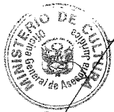
PATRICIA BALBUENA PALACIOS MINISTRA DE CULTURA