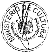
..... SALVADOR DEL SOLAR LABARTHE Ministro de Cultura