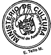
DIANA ALVAREZ-CALDERON Ministra de Cultura