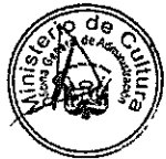
DIANA ALVAREZ-CALDERÓN Ministra de Cultura