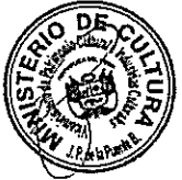
..... DIANA ALVAREZ-CALDERÓN Ministra de Cultura