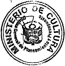
DIANA ALVAREZ-CALDERÓN Ministra de Cultura