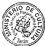
DIANA ALVAREZ-CALDERÓN Ministra de Cultura