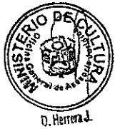
DIANA ALVAREZ-CALDERÓN Ministra de Cultura