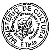
..... DIANA ALVAREZ-CALDERÓN Ministra de Cultura