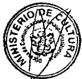
DIANA ALVAREZ-CALDERÓN Ministra de Cultura