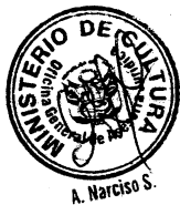
LUIS ALBERTO PEIRANO FALCONI Ministro de Cultura