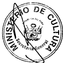
LUIS ALBERTO PEIRANO FALCONI Ministro de Cultura