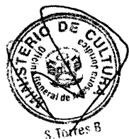
LUIS ALBERTO PEIRANO FALCONI Ministro de Cultura