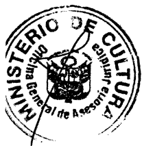
LUIS ALBERTO PEIRANO FALCONI Ministro de Cultura