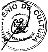
JUAN OSSIO ACUÑA Ministro de Cultura